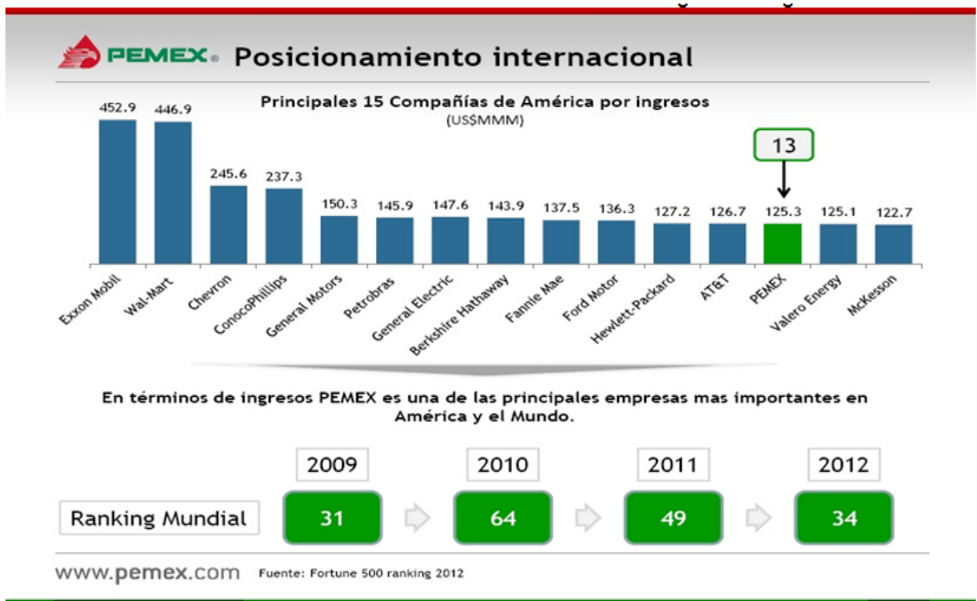
Gráfica 2: Posicionamiento de Pemex en el mundo según sus ingresos