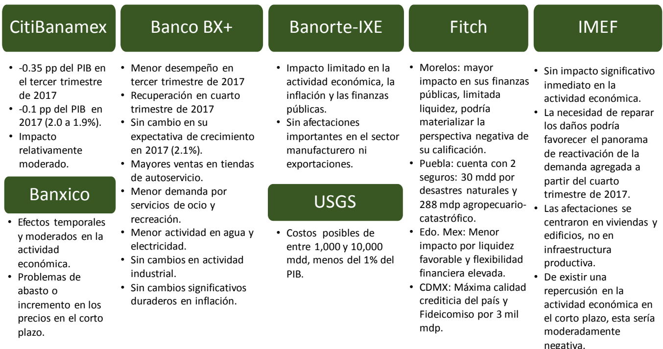
Esquema 1. Algunas estimaciones de los costos de los sismos de septiembre de 2017

Para Fitch (2017) las implicaciones derivadas del sismo en la Ciudad de México, Morelos, Puebla y Estado de México, serán diferentes para cada entidad. Aunque estimó que el impacto sería mitigado a corto y mediano