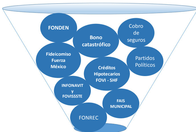
Figura 2. Fuentes de Financiamiento para la reconstrucción