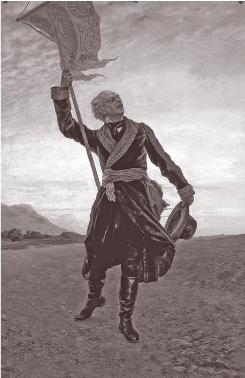
Antonio Fabrés, Miguel Hidalgo , óleo sobre tela, siglo XIX.