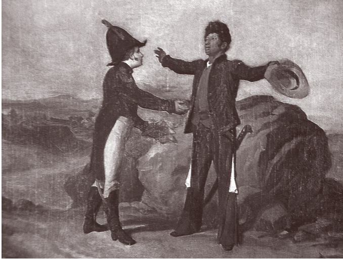
Román Sagredo, Abrazo de Acatempan (1870), óleo sobre tela.

el futuro. Es sencillo ver las diferencias que se tienen con un rival, son tan notorias y evidentes que se pueden combatir en un campo de batalla. Se requiere, sin embargo, de un don muy especial para ver las similitudes en el contrincante y buscar más allá del filo de una espada para lograr un acuerdo. He ahí la grandeza de nuestro proceso de independencia. Fue producto de la construcción y no de la destrucción, y eso es algo que no deberíamos olvidar nunca.