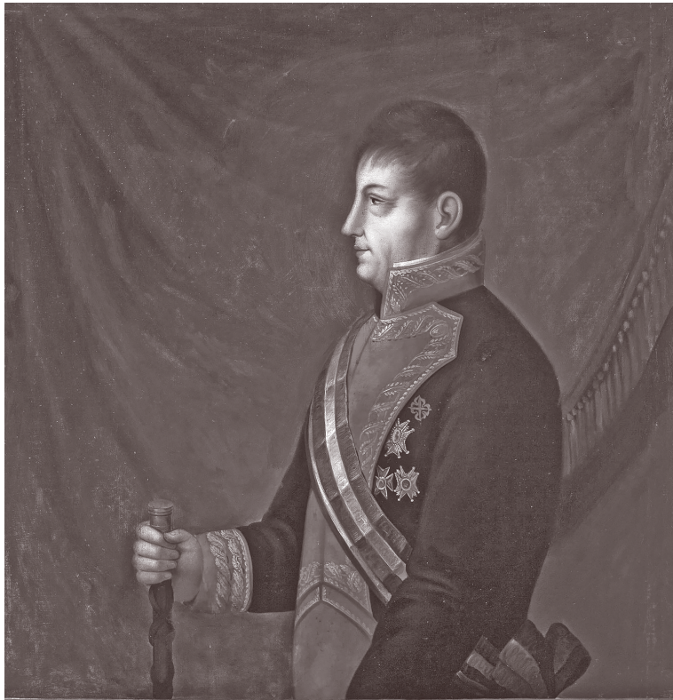
Exmo. S. TEN. GRAL. D. JUAN O'DONOJÚ Sevillano Ultimo Virrey de Nueva España: prestó el Juramento en Veracruz en 3. de Agosto de 1821, firmó los tratados de Cordova en 24 del mismo y murió en 8 de Oct. del mismo año