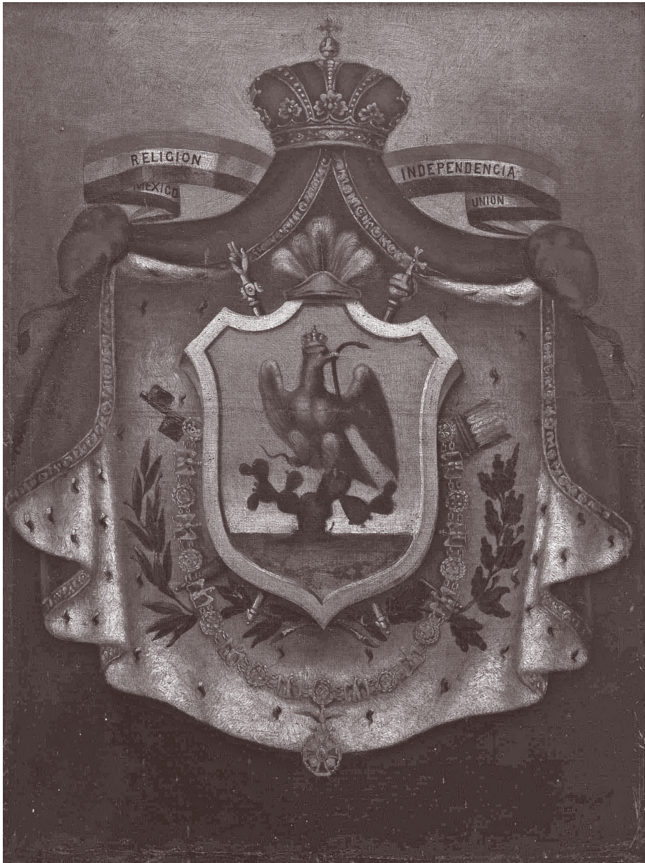
Anónimo (siglo XIX), Escudo del Primer Imperio Mexicano (1821-1823) y de la Regencia del Segundo Imperio Mexicano (1863-1864).