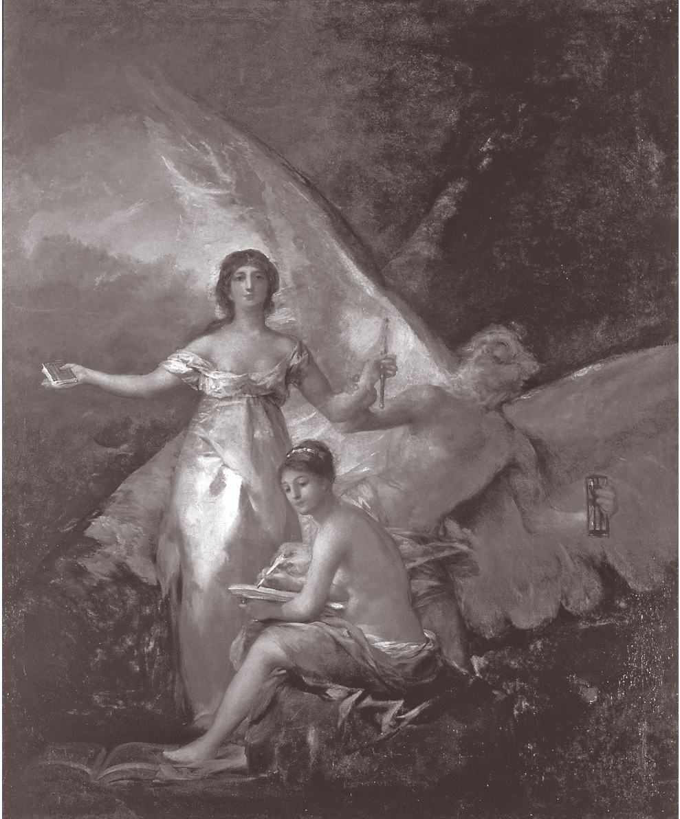
Francisco de Goya (1800), La Verdad, el Tiempo y la Historia , alegoría de la Constitución de 1812.