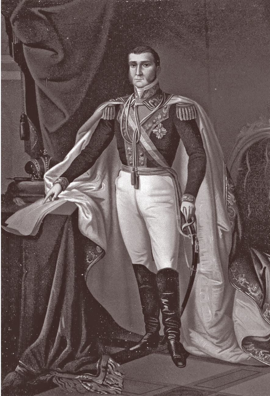
Retrato de Agustín de Iturbide como emperador de México.