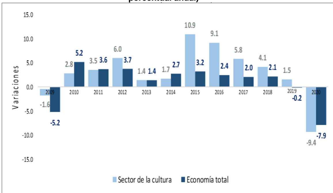
Gráfica 3: Comportamiento del PIB del Sector de la Cultura– 2020 (variación porcentual anual)