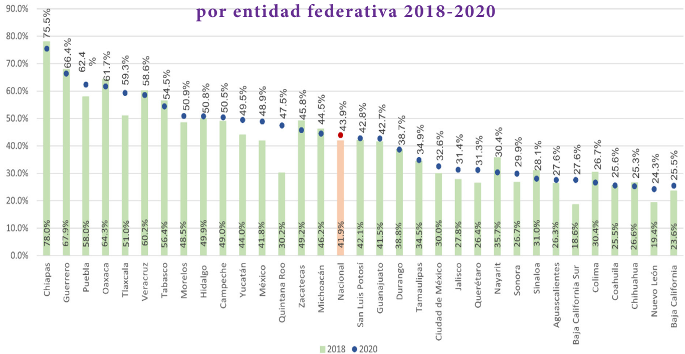
Gráfico 1. Porcentaje de la población en situación de pobreza, por entidad federativa 2018-2020