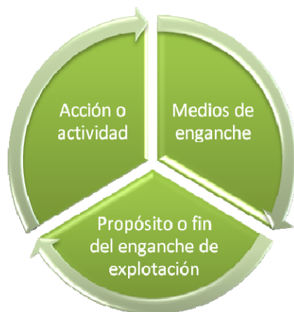
Cuadro 1. Elementos del delito de Trata

De alguna forma en el Protocolo de Palermo, se mencionan la existencia de tres componentes que están ligados entre sí: la acción o actividad, los medios, y el propósito o fin, los cuales, forzosamente, deberán confluir para configurar el delito. (cuadro1). La acción o actividad se refiere a “[...] la captación, del transporte, el traslado, la acogida o la recepción de personas [...]”. Implicando el traslado físico de un ser humano, dentro de un país o cruzando fronteras entre dos o más países. Los medios de enganche , “[...] la amenaza o uso de la fuerza, coacción, raptó, fraude, engaño, abuso de poder, vulnerabilidad, la concesión o recepción de pagos o beneficios para obtener el consentimiento de una persona que tenga autoridad sobre otra con fines de explotación [...]”. El propósito o fin de la explotación, incluirá, como mínimo, “la explotación de la prostitución ajena u otras formas de explotación sexual, los trabajos o servicios forzados, la esclavitud o las prácticas análogas a la esclavitud, la servidumbre o la extracción de órganos” 2 .