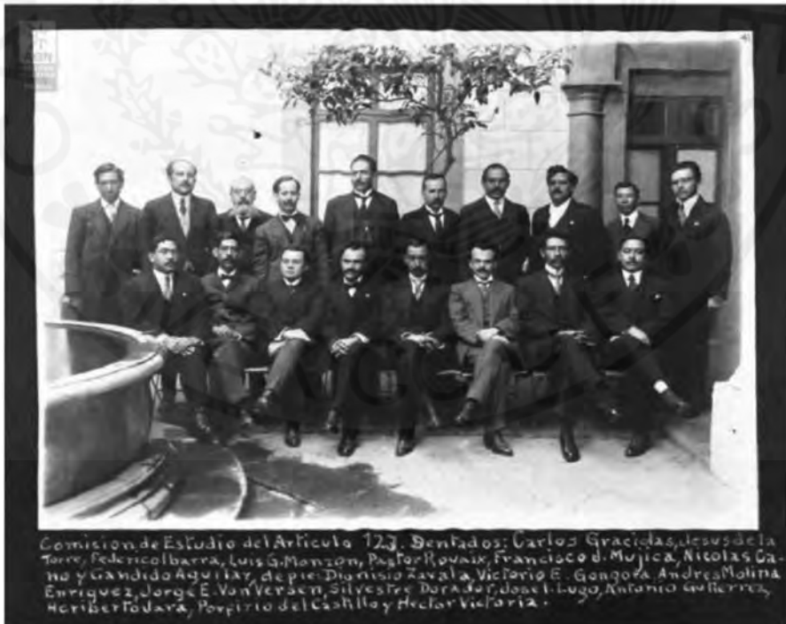
Diputados miembros de la Comisión de estudio del artículo 123 constitucional.