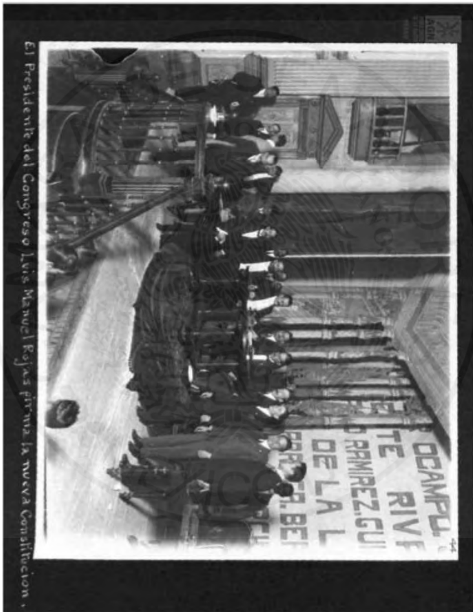
Firma de la Constitución de 1917 por el Presidente del Congreso Constituyente.