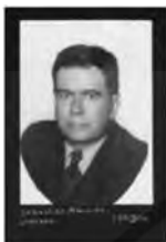
JALISCO 19° CIUDAD GUZMÁN

profesionales en el Liceo de Varones de Guadalajara. Cuando el 20 de noviembre de 1910 Madero lanzó el grito de rebelión contra el Gobierno Porfirista, se lanzó a la lucha empuñando las armas, uniéndose a grupos maderistas para después secundar a los Carrancistas. Fue electo Diputado Constituyente por Ciudad Guzmán. Después de firmar la Constitución se retiró a Guadalajara, donde ejerció su profesión. Falleció el 17 de diciembre de 1947.