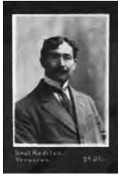
VERACRUZ 3º CHICONTEPEC