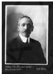
MICHOACÁN 10º PÁTZCUARO