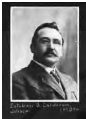
JALISCO 18° SAN GABRIEL