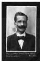
MICHOACÁN 9º ARIO DE ROSALES

estudios diversos sobre plantas michoacanas. tales como “Breves noticias acerca de algunos productos volcánicos de las inmediaciones de Morelia”, “Impresiones de Plantas en Rocas Basálticas”, “Plantas Indígenas”. Formó parte del X Congreso Geológico Nacional celebrado en la Ciudad de México. Diputado Constituyente. Posteriormente Regente del Colegio de San Nicolás y falleció el 14 de diciembre de 1924.