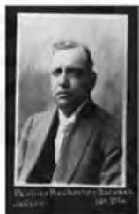
JALISCO 19° CIUDAD GUZMÁN

salarios, convenciéndolos para irse a la huelga. Baca Calderón y Manuel M. Diéguez, fueron acusados de asesinato y condenados a 15 años de prisión en San Juan de Ulúa. En 1912, una vez liberado de prisión por las fuerzas revolucionarias fue Presidente Municipal de Cananea y Director de la Escuela Buenavista. En diciembre de 1912 dirigió con Juan José Ríos la huelga de Cananea, siendo encarcelado en Hermosillo. En 1913 combatió en Naco, Sonora incorporado a las fuerzas de Álvaro Obregón participando en el sitio de Culiacán, donde perdió un ojo. En 1915, Gobernador Interino de Colima. En 1916, Director General de Rentas de Jalisco. Diputado Constituyente y en 1929, Gobernador Constitucional del Estado de Nayarit. Fue Presidente de la Junta de Mejoras Materiales de Laredo. Jefe de Establecimientos Fabriles Militares. En 1939 alcanzó el grado de General de División. Tres veces Senador de la República. En el año de 1956 fue honrado con la Medalla "Belisario Domínguez". Murió en la Ciudad de México el 29 de marzo de 1957.