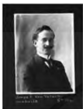
COAHUILA 5° PIEDRAS NEGRAS