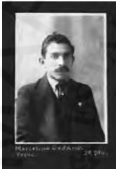
TEPIC 2º IXCUINTLA

Constituyente a Querétaro. Posteriormente fue Diputado Federal por Guadalajara, Jalisco. Fue después comandante del 4o. Regimiento de Zamora, Michoacán. Luego estuvo en Mazatlán, Sinaloa. Fue agente del Ministerio Público en Mexicali, Baja California Norte. Presidente del Consejo de Guerra de Guaymas, Sonora. Prestando servicios al General Abelardo L. Rodríguez, para después ser miembro de la Comisión de Historia de la Secretaría de Guerra y Marina, posteriormente desempeñó funciones en el ejército del que era General de División retirándose del servicio por haber llegado a la edad límite. Falleció en la Ciudad de México el 11 de abril de 1964.