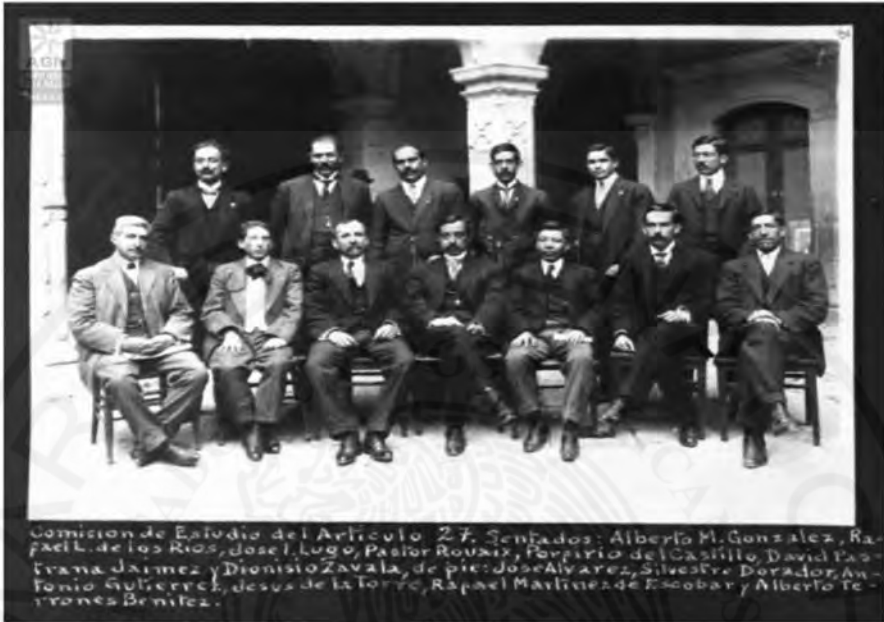
Diputados miembros de la Comisión de estudio del artículo 27 constitucional.