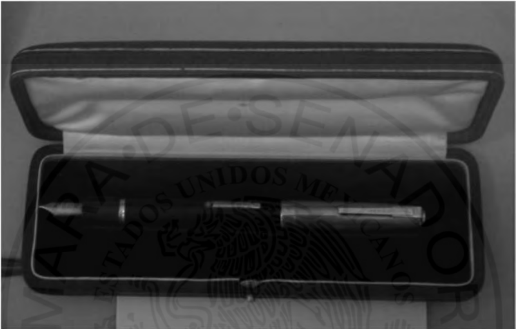
Pluma con que se firmó el Plan de Guadalupe y la Constitución de 1917.