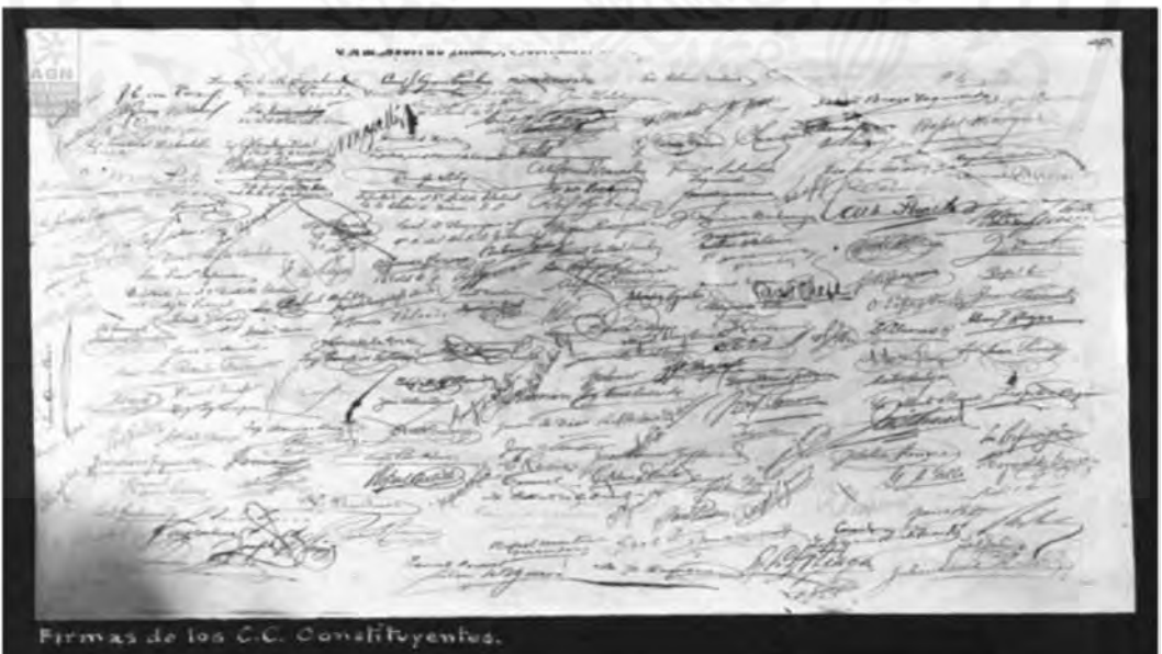
Firmas de los Constituyentes de 1916 – 1917.