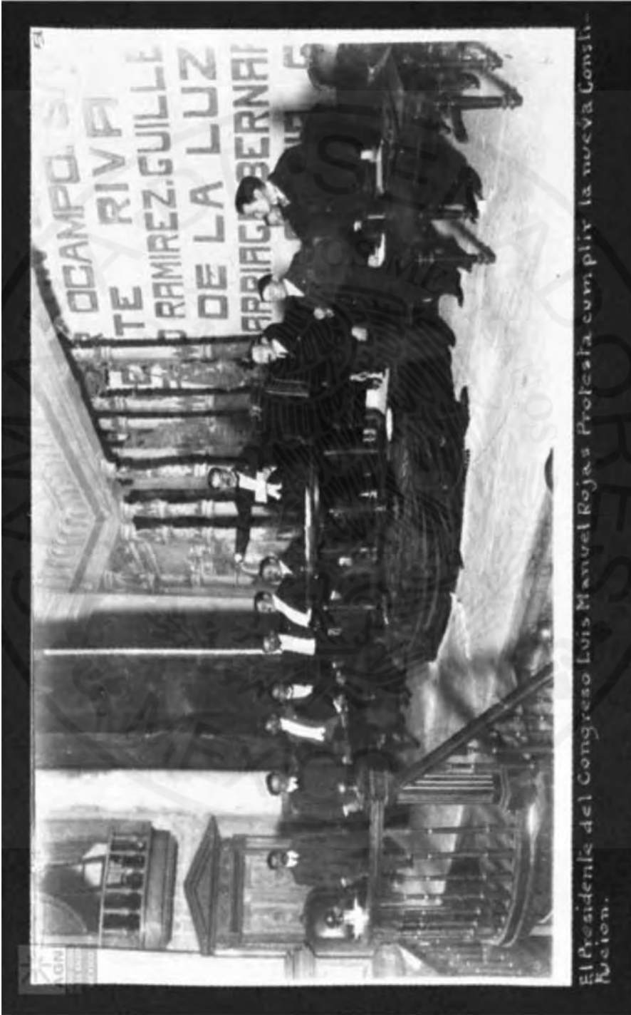
Protesta cumplir la Constitución el Presidente de la Mesa Directiva del Congreso Constituyente.