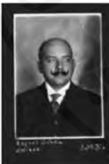
JALISCO 20° MAZAMITLA