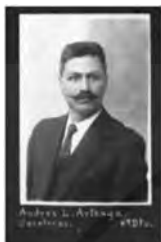
ZACATECAS 7º JUICHIPILA