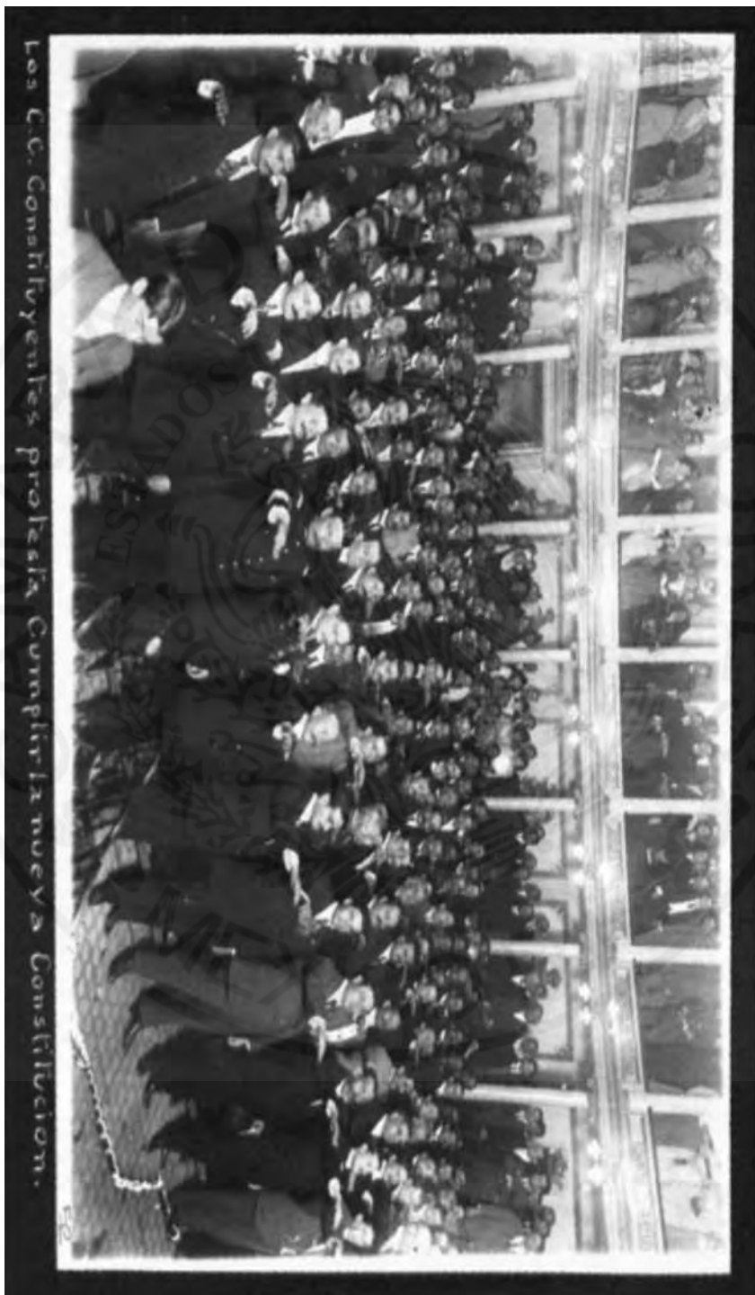
Protestan cumplir la Constitución los Diputados miembros al Congreso Constituyente 1916 - 1917.