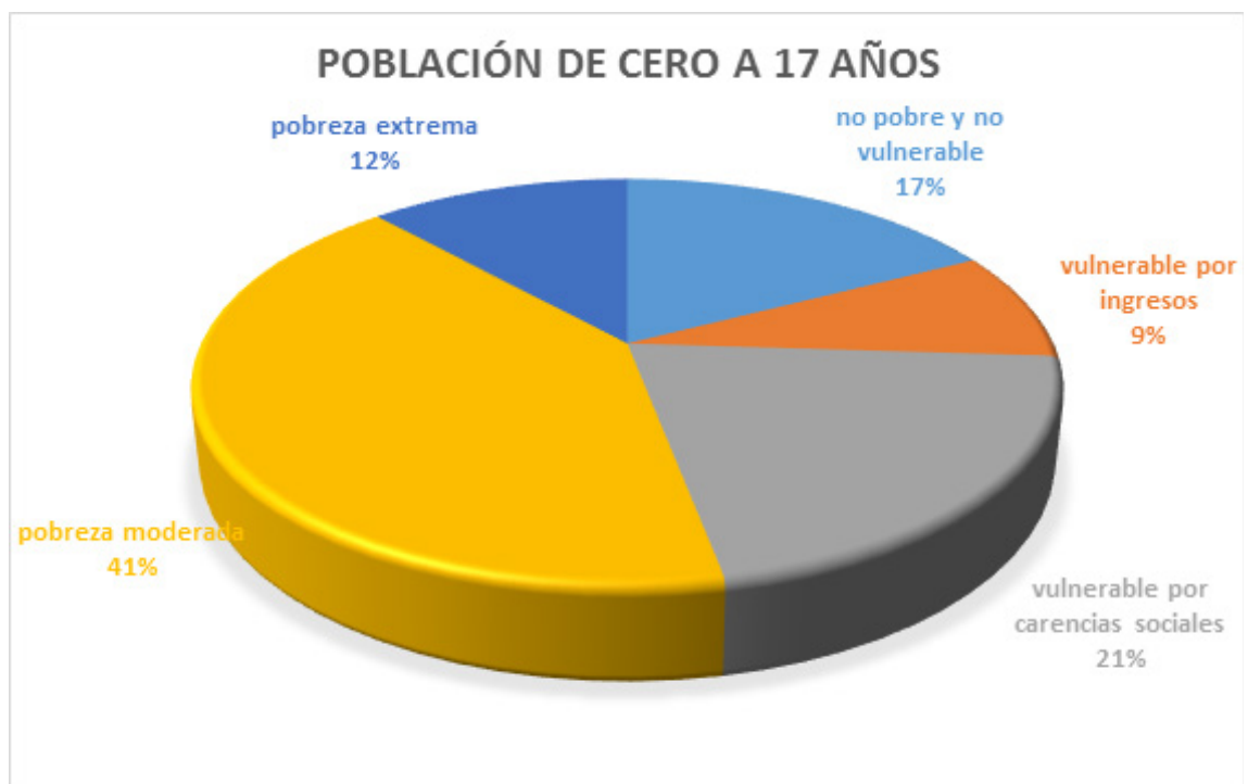
Gráfica 2. Diferentes grupos de pobreza en la niñez mexicana.