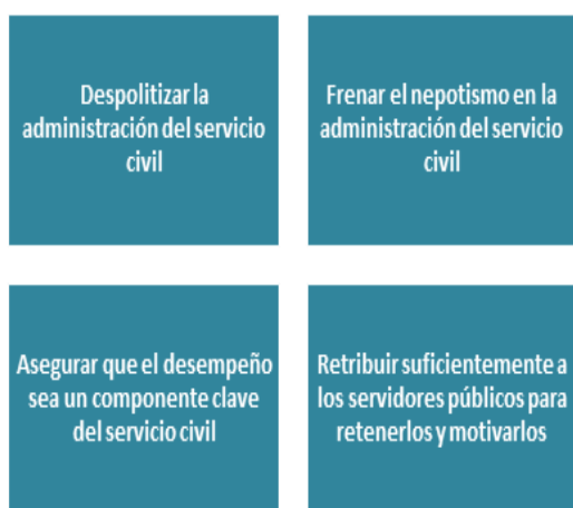
Fig. 1. Buenas prácticas en materia de reformas a los servicios civiles