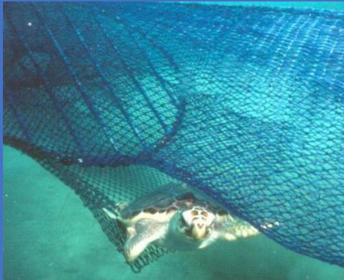
NOM-061-SAG-PESC/SEMARNAT-2016, Especificaciones técnicas de los excluidores de tortugas marinas utilizados por la flota de arrastre camaronera en aguas de jurisdicción federal de los Estados Unidos Mexicanos.