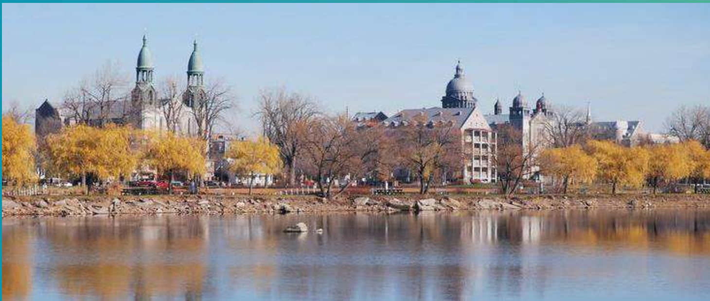
4-Antiguo convento religioso convertido en colegio