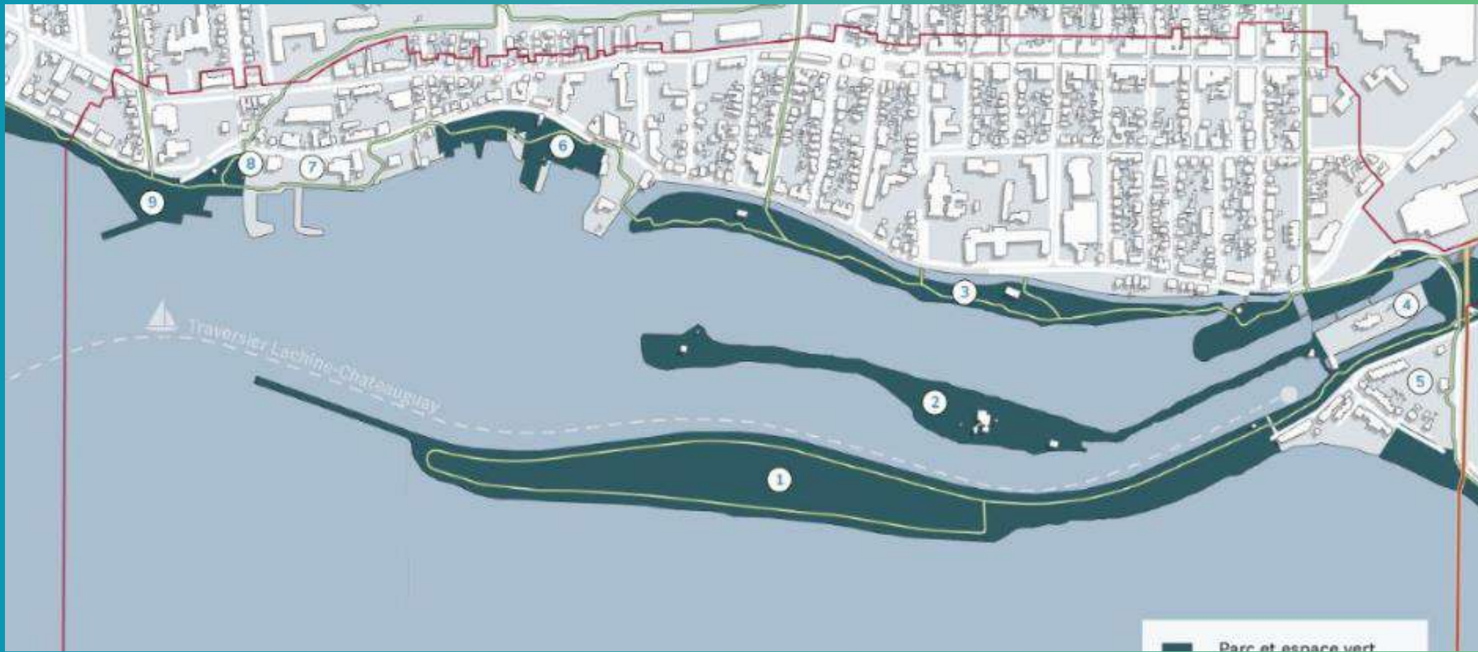
1-Plan de desarrollo de la bahía de Lachine