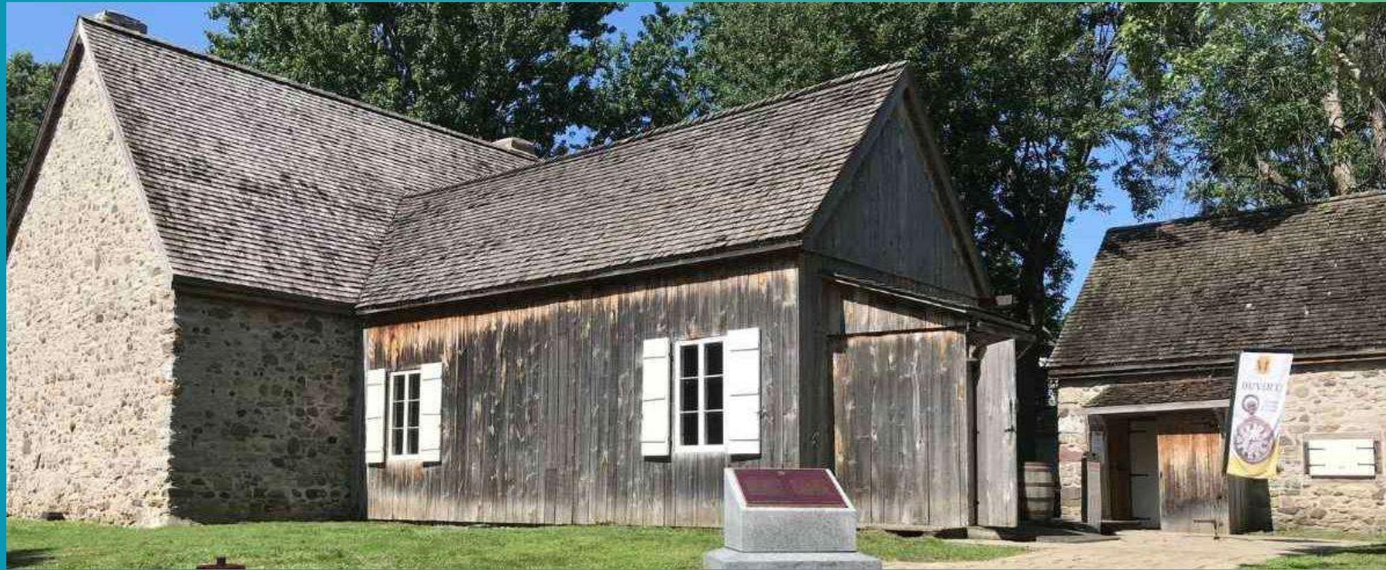
1- La casa más antigua de Montreal convertida en museo