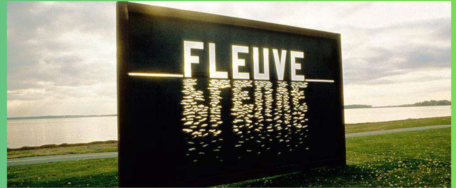
2- Parque Stoney point, Montréal (Lachine)