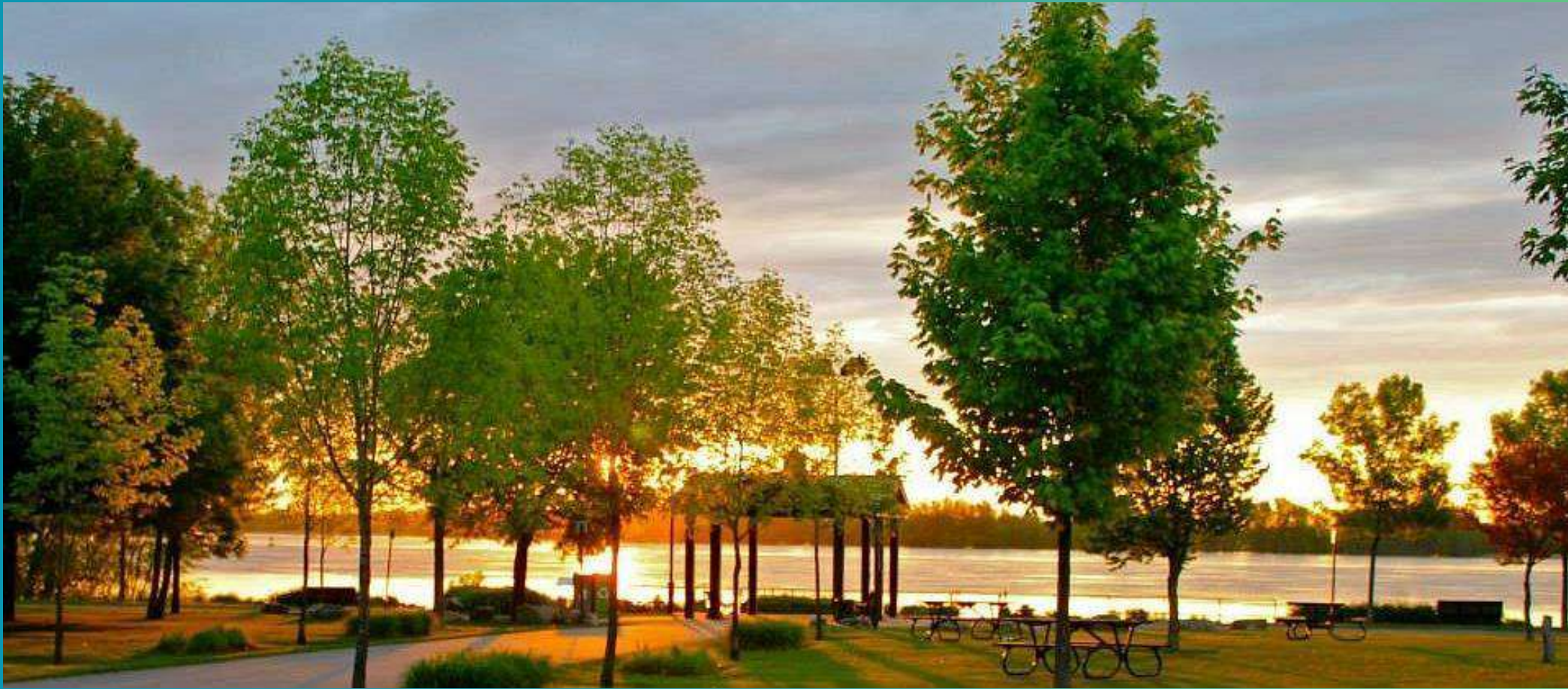
1- Parque ribereño Bellerive, Montréal